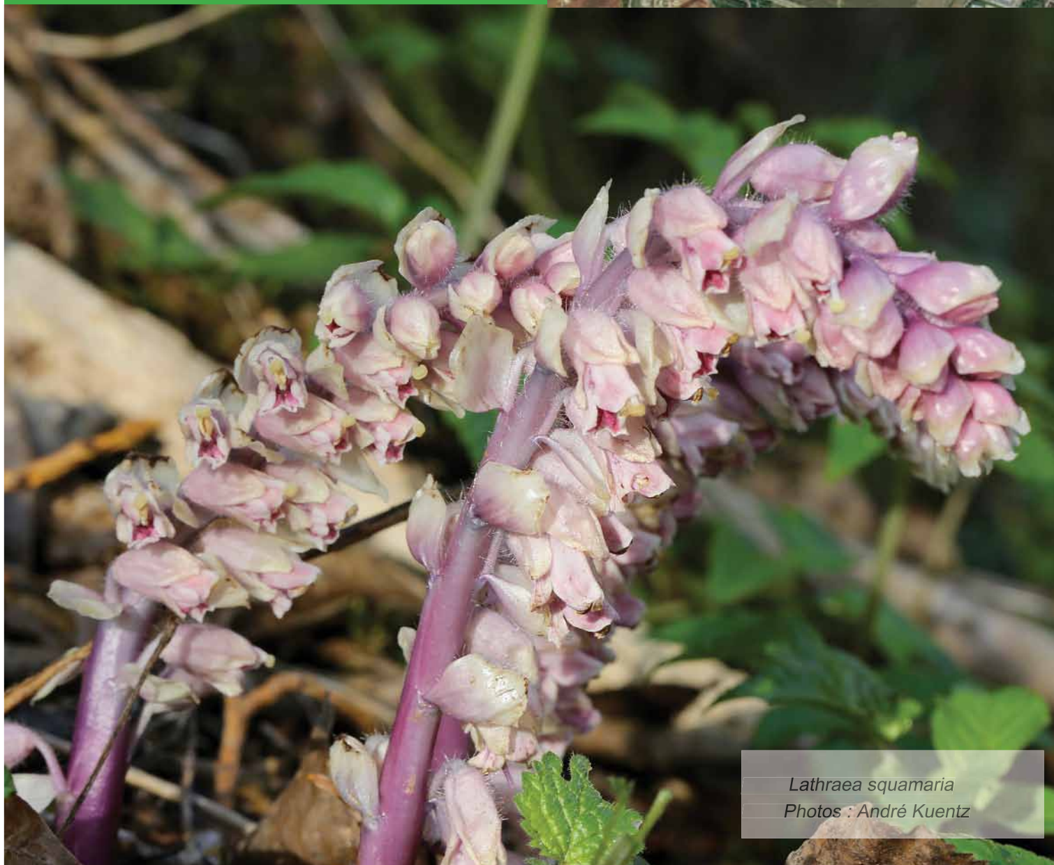
Lathraea squamaria

Sortie en partenariat avec les Amis des Plantes du Florival. L'Ochsenfeld (champ aux bœufs) était autrefois une grande lande caillouteuse -cône de déjection de la Thur- impropre à la culture. Il n'en reste aujourd'hui que des lambeaux épars.