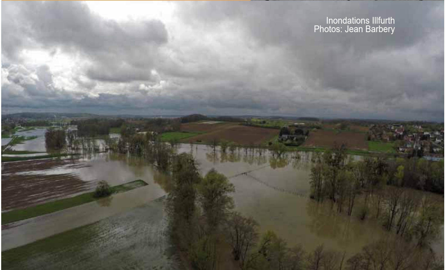
Inondations Illfurth