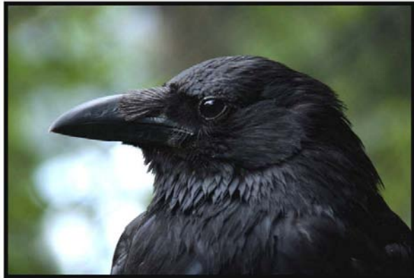
Corneille noire ( Corvus corones )

Au cours de cette conférence, seront abordées la compréhension du temps chez les corvidés et la capacité de ces espèces à utiliser les propriétés physiques des objets pour optimiser leur recherche de nourriture. Leurs compétences sociales, et plus particulièrement leurs capacités en termes d'apprentissage social et de coopération ont également été mises en évidence. On peut ainsi constater que leurs performances sont bien souvent comparables à celles d'espèces plus proches de nous comme les singes et les grands singes.