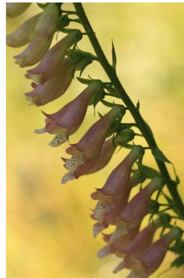
Hybride naturel entre Digitalis purpurea L. et Digitalis lutea L.

Au cours de cet exposé, après avoir fait quelques rappels sur la reproduction chez les plantes, nous étudierons comment les plantes se protègent de l'hybridation. Finalement, nous terminerons par des exemples chez les digitales.